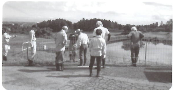
(イノシシ対策現地視察)