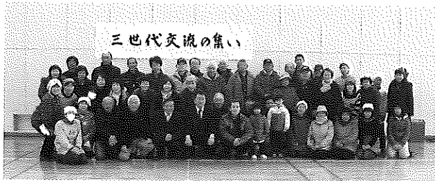
三世交代流の集い

前日から雪が降り寒い日になりましたが、各種団体の協力のもと、小学生、保育園児が参加して、楽しく活動することが出来ました。