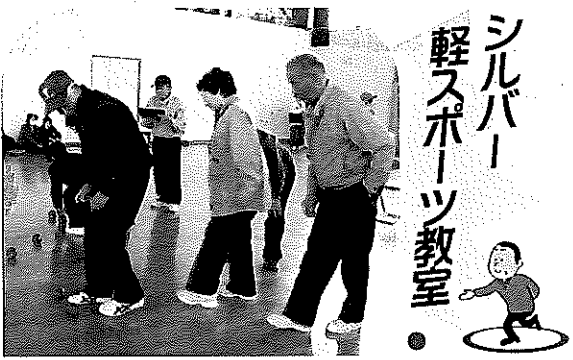
去る四月十日に、シルバースポーツ教室を開催致しました。老人クラブベータンク部会の総会を兼ねてベタンク交流会を行いました。 また寒い体育館でしたが、賑やかな声がひびき、なごや

あつてマイナス40度の気温のなかでも露天風呂は気持ちいいよというところで、体はほかほか、頭の髪の毛は一瞬のうちに白く凍るそうです。そして、天然ガスが豊富にあつて、家の中はセントラルヒーティングがされ電気も火力発電で送電されているので、生活には困らないそうです。