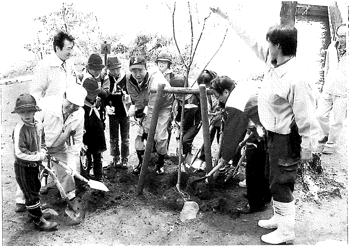
(南砺の山々を守る!) 植樹祭