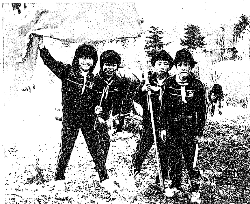
黒部市嘉例沢の富山県植樹祭