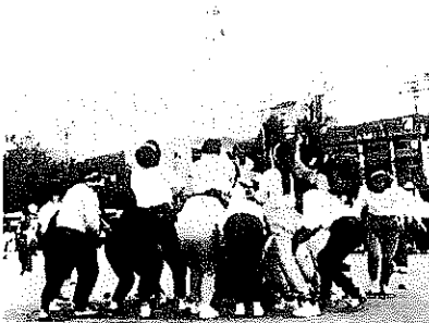
第21回 井波町体育祭総合得点表

天候に恵まれず、三年続きの屋内での競技となり、種目も幾つか変更されましたが、どのチームも積極的に多数の参加が見られ、すぐ目の前で見る競技に歓声と拍手が響き渡り、場内は熱気一杯。 来年こそは青空の下で思いきり全種目をこなしたいものです。 成績は次の通りです。