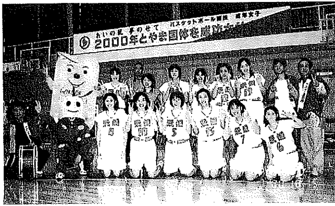
▲愛媛チームの皆さん