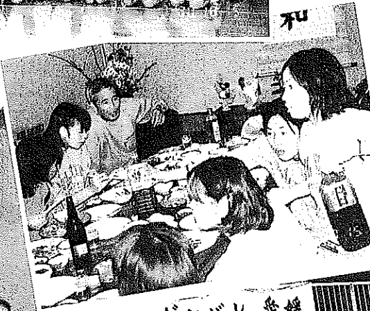
◀ おいしく いただきます