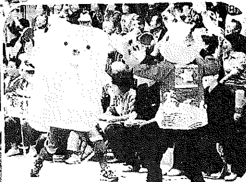
▲特産みかん乱舞