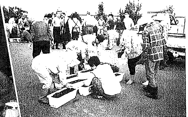
▲国体のプランター花植え