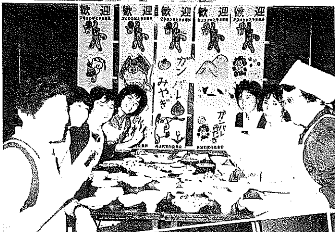
▲スタミナ、つけてね!!