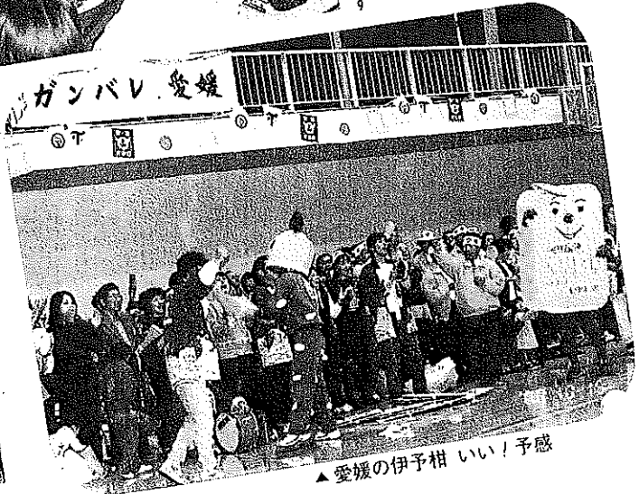
▲愛媛の伊予柑 いい！予感