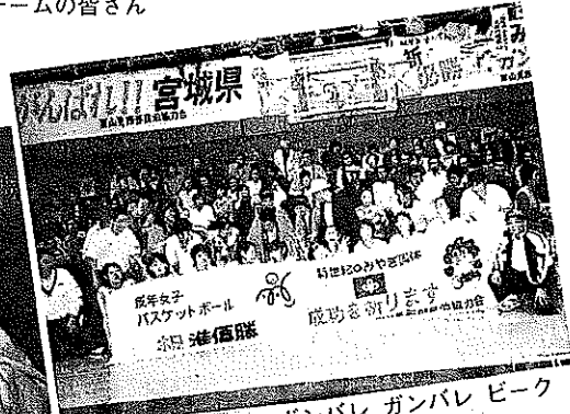
▲ガンバレガンバレピーク ケッパレ宮城