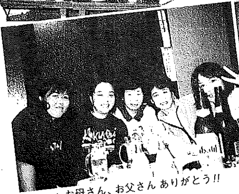
▲お母さん、お父さんありがとう!!