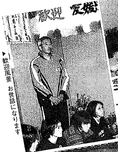
▶ 歓迎風景 お世話になります