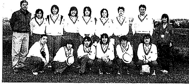
▲宮城チームの皆さん