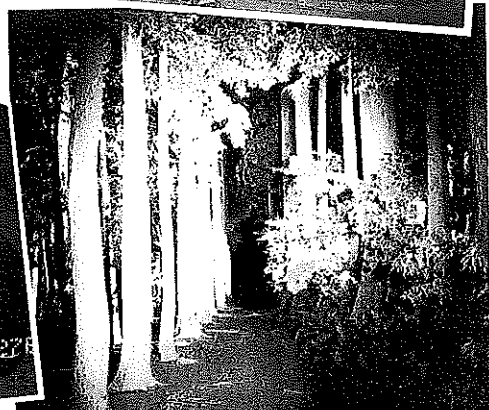
「馬かけ場」のライトアップ