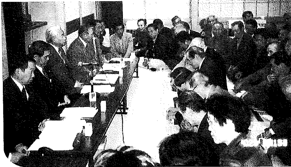
市町村合併を考える 地区別懇談会風景