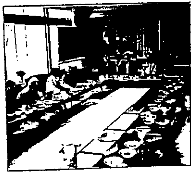
シルバー 会食サービス