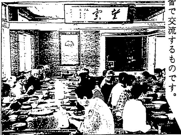
▼老人を招いての会食会（ミニ託老所）

この対象とする処は、高齢者のため、保養旅行やゲートボール等に参加出来ないような方と皆で交流するものです。