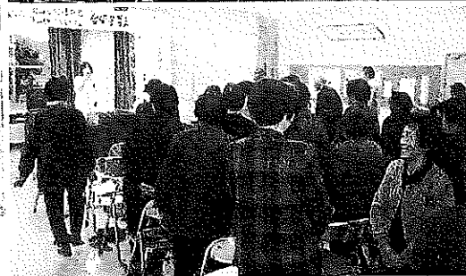
八乙女福祉 カレッジ風景