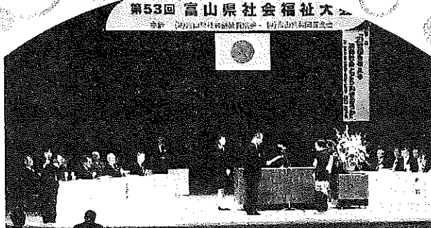
社会福祉法人 富山県社会福祉協議会会長表彰

昨年10月12日県民会館大ホールで、第53回富山県社会福祉大会が開催されました。式典には富山県知事表彰、富山県社会福祉協議会会長表彰、富山県共同募金会会長表彰が有り、当南山見地区社会福祉協議会がみごと富山県社会福祉協議会会長表彰をうけました。