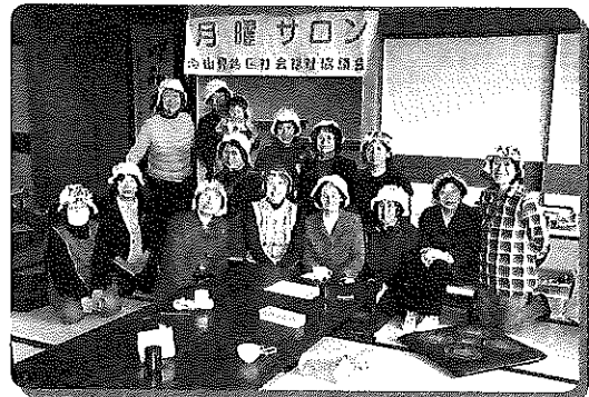
手ぬぐいで簡単に作れる帽子