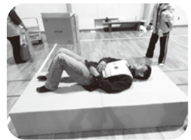
ダンボールベッドの寝心地は？

日頃の防災訓練に参加することで、いざという時の備えになります。南山見地区は災害に対し「共助が強い」と言われる地区になるよう皆さまのご理解ご協力をお願いいたします。