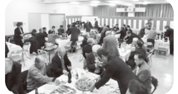
和気あいあいと歓談しました

災害により、中止となった年もありましたが、今年は、心穏やかに新年を迎えることができ感謝申し上げます。