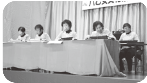
透き通った音色の大正琴

ステージ発表では、子ども民謡教室の児童らによる愛らしい踊りを皮切りに、詩吟、民謡、大正琴や、AIでカラー化を施した記録映画『六石六斗』の上映が行われ、会場いっばいに歓声や笑顔が花開きました。