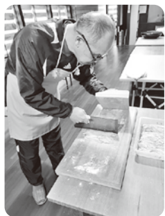
大きさを揃えて慎重に…

12月14日（日）、利賀村の施設で「そば打ち体験」をしました。参加人数は少数でしたが、普段は味わえない良い経験ができました。