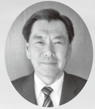
南山見地域くへり協議会