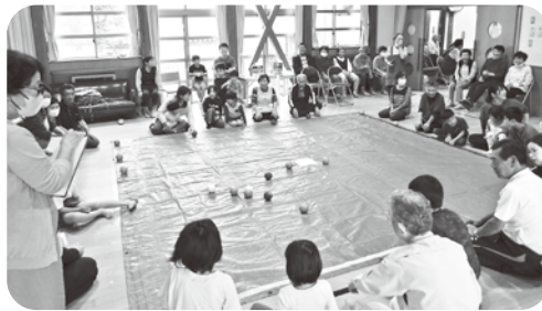
白い玉に一番近いのは誰のボールなの?

このポッチャは、4つのチームが正方形の各辺に分かれ、チームごとに赤、青、黄、緑の球を6個ずつ持ち、最初のチームが投げた白い玉を目掛けて1人ずつ自分の玉を順に投げ、白い玉に最も近づけたチームに得点が入るゲームです。白熱した展開となり、「惜しい」「いいぞ!」などの歓声、笑顔、ため息