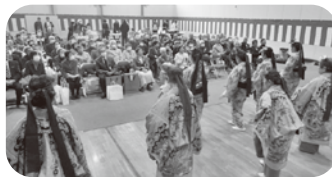
踊りや民謡を楽しみました

この行事は、南山見の誇りでもあります。この行事の開催にあたり、ご協力をいただきました皆さまに感謝いたします。