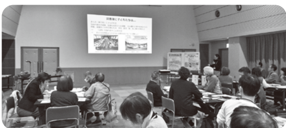
グループでもしました

CFS（チャイルドフレンドリースペース）とは、災害や事故などにおいて、避難先で子どもたちが安心して、そして安全に過ごすことができる場所を指します。ここでは、子どもたちの遊びや学び、こころやからだの健康を支えるための多様な活動や情報が提供される空間となります。災害時こそ「子どもに優しい空間」を、みんなで支え合い協力して作り上げましょう。