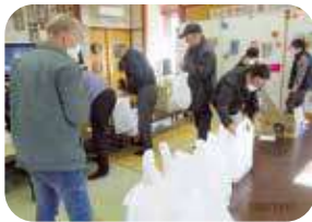
これからお宅に訪問します

12月6日(土)、南山見地区社会福祉協議会で、年末に恒例となっています「歳末見舞い訪問」を行いました。