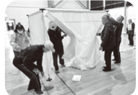
プライベートルームの組立