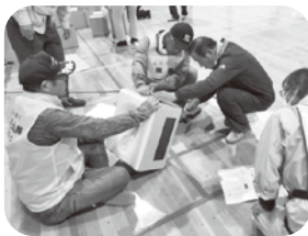
簡易トイレの組立

「白タオル」が掲示してあれば、戸別に声をかけて家族全員の無事を確認する戸数が減り、早期に災害時の人的被害の把握ができると思いますので、今後の防災訓練では「白タオル」の掲示率が少しでも100%に近づいていくようにしたいと思います。