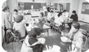
温かいうどんは大盛況

終わりに、出演・出品いただいた方々、準備から片付けに至るまでご協力いただいた実行委員、各種団体、町内会等、多くの皆さまに心より感謝申し上げます。