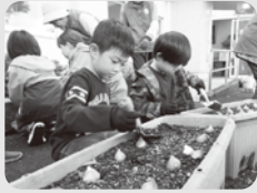
何色のチューリップかな

11月2日(日)、南山見交流センターで、児童クラブの花壇づくりと文化祭展示作品作りを行いました。