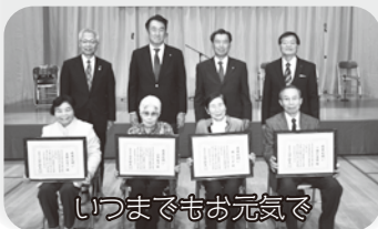
いつまでもお元気で