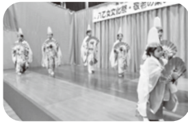
上手な踊りに拍手喝采