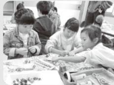
可愛い飾りがあったね

講師の先生が持ってきてくださった、可愛いモチーフや落ち葉を糸で繋げながらバランスを考え、みんな楽しみながら「モビール作り」に取り組むことが出来ました。