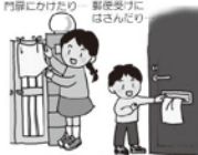
門扉にかけたり、扉裏側に貼るに

各集落の公民館への1次避難訓練参加者は269名。その後、2次避難所となっている南山見交流センターへ徒歩等で集まっていただきました。2次避難所には、70名余りの地区の皆さま