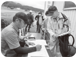
「私の町内は全員無事です」

こうと考え、防災無線の災害発生訓練の発報時にサイレン吹鳴を入れ、肉声のアナウンスでは聞き取りにくいことからデジタル音声放送に変更しました。放送を合図に、全てのご家庭では玄関先に無事（人的被害がない）を知らせる「白タオル」の掲示訓練に参加していただきました。南山見地区全体の「白タオル」掲示率は、67.7%でした。