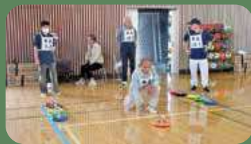
ポイントゾーンを狙って、確実に…

カローリングは、天候に関係なく誰でもできる軽スポーツです。ひとつやってみようかなと思う方は、まず会員に声をかけてください。お待ちしております。