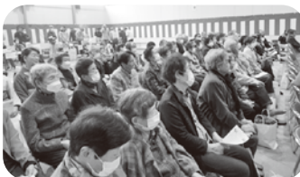
大勢の方で賑わいました

この行事は、南山見の誇りでもあります。この行事の開催にあたり、ご協力をいただきました皆さまに感謝いたします。