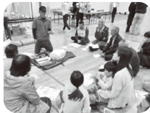
AED を使いみんなで救助