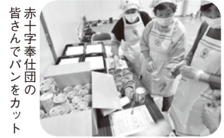
赤十字奉仕団の皆さんでパンをカット