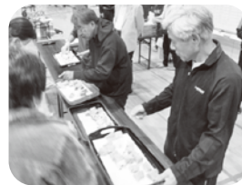
「非常食の缶入りパンはいかがですか」