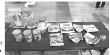
様々な非常食があります