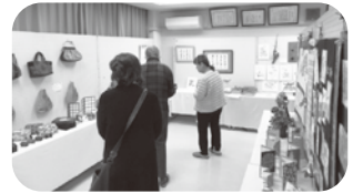
力作ぞろいの作品展示