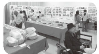
見事な出来の農作物