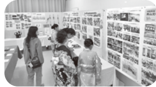
各種団体の活動報告

による血圧測定や健康チェック、茶道クラブによるお茶席も設けられ、和やかな語り・交流の場となりました。