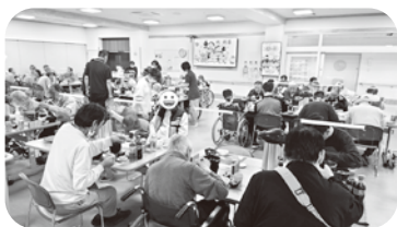
みんなで楽しく忘年会

昭和34年、富山県で初めて身体障害者授産施設として開設され、昭和48年に現在地に移転新築して以来、地域の皆さまに支えられて52年が経過いたしました。その間、障害者総合支援法による3障害一元化により、身体障害者に加え精神・知的障害者の受入れや、利用者の高齢化・重度化が進み、福祉サービスが多様化しており以前の施設では対応が難しくなりました。